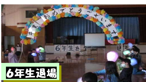
6年生幕間のサイロトーク(運営委員の企画による)